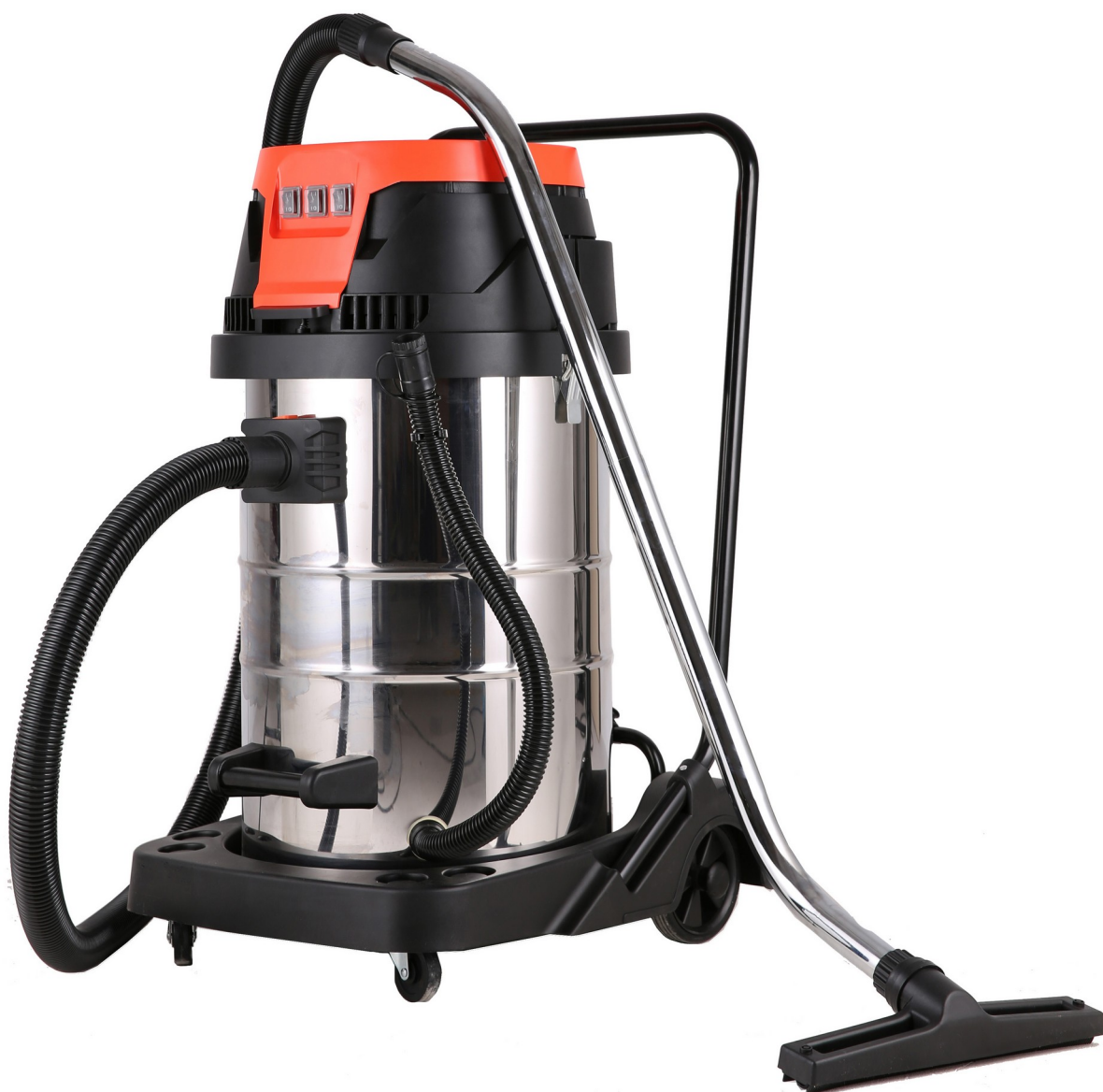
Maltec odkurzacz TurboVac ML3000W Instrukcja obsługi i konserwacji